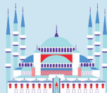
MEŠITA SULTÁNA AHMEDA

Chrám Matky Božej v Paríži sa nachádza v centre mesta Paríž, v časti Île de la Cité. Notre Dame je majstrovské dielo gotickej architektúry. Katedrálu dokončili v 15. storočí a v roku 2020 oslavuje 857. výročie výstavby. Bola hlavným znakom Paríža, ale bohužiaľ ju poškodil veľký požiar v apríli 2019, ktorý zničil jej strednú vežu, ktorá mala výšku nad 96 m.