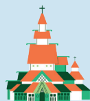
DREVENÝ KOSTOL BORGUND

Nachádza sa v Londýne v Anglicku, sú to slávne hodiny budovy parlamentu, ktorý bol postavený v roku 1858. Veža je vysoká takmer 106 metrov a po obvode sú 4 ks obrovských hodín, jedny pre každú stranu. V súčasnosti sú to najspohľadlivejšie hodiny aké existujú a vydržia akékoľvek zlé počasie. Názov „Big Ben“ v skutočnosti hovorí o tom, že vo vnútri veže sú umiestnené hodiny, ktoré vážia 14 ton.